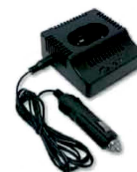
obj. č. 33153