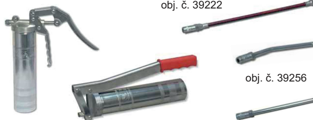
obj. č. 38132