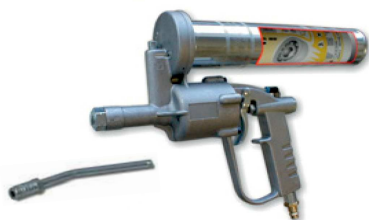
obj. č. 38201

Všechny uvedené mazací nástavce obsahují čtyřčelistovou mazací spojku určenou pro napojení na mazací hlavice kulové (typ H dle DIN 71412).