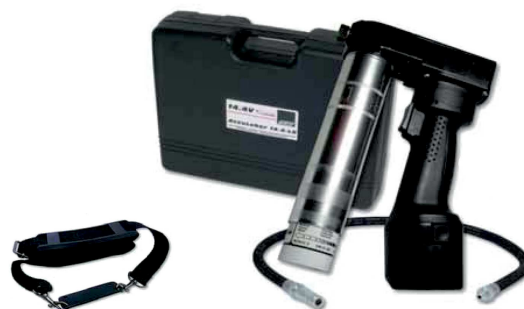
obj. č. 33145

obj. č. 33154....Akumulátor pro AccuGreaser 18 V obj. č. 33152....Nabíječka pro AccuGreaser 18 V-230 VAC obj. č. 33153....Nabíječka pro AccuGreaser 18 V-12/24 VDC obj. č. 33145....Ramenní popruh