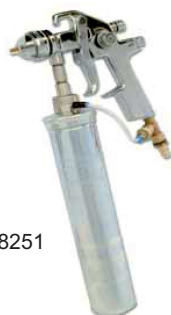
obj. č. 38251