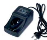
obj. č. 33152