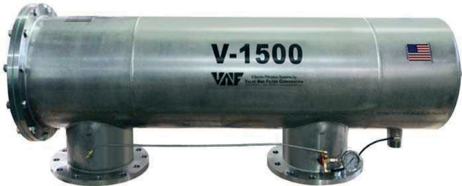
V-1500 Automatický filtr