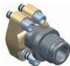
Adaptér HFS s pripojením AG 2" a SAE výstupom

Výrobné tolerancie nejsou zohľadnené. Zmeny vyhradené.