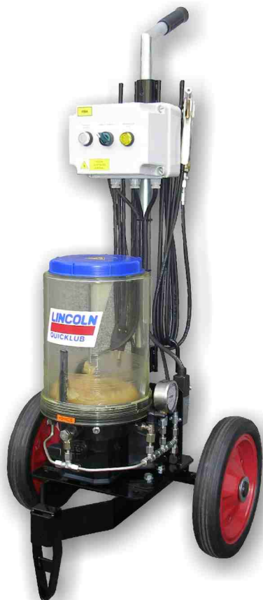
Pojízdny mazací přístroj AM 203, obj.č. 924101 08

Zapsán do obchodního rejstříku u Krajského soudu v Ústí nad Labem v oddíle C, č. vložky 274