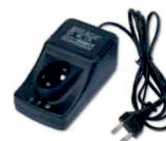
obj. č. 33152