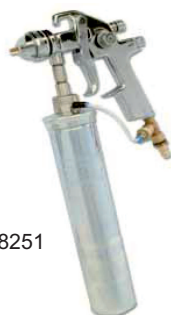
obj. č. 38251