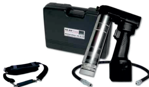
obj. č. 33145

obj. č. 33154....Akumulátor pro AccuGreaser 18 V obj. č. 33152....Nabíječka pro AccuGreaser 18 V-230 VAC obj. č. 33153....Nabíječka pro AccuGreaser 18 V-12/24 VDC obj. č. 33145....Ramenní popruh